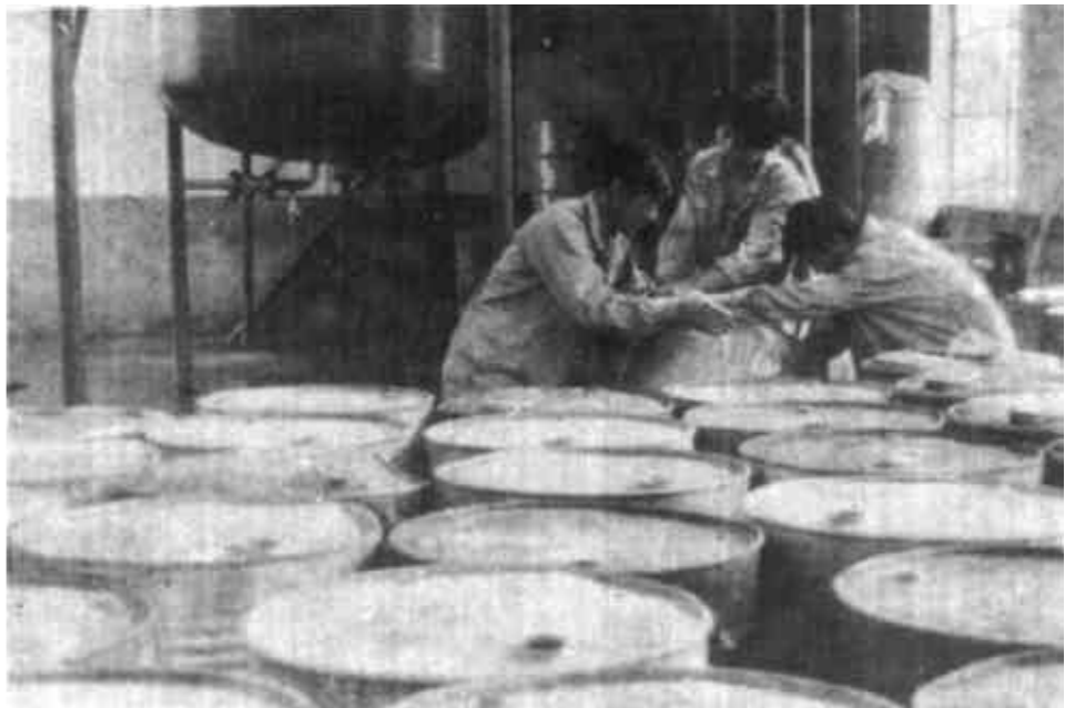
东营区胜利镇充分发挥区位优势，积极围绕油田上项目。今年以来，该镇先后投资200余万元，新上两家生产石油助剂等产品的企业，可望取得良好效益。

全县有8个乡镇的兽医站建设通过市级验收，现有3处活畜交易市场正在积极建设中，形成了畜产品冷藏加工——畜产品综合加工——活畜交易市场为主体的全方位系列化服务体系。（三）依法治牧。认真开展了畜牧法规宣传月活动，定期不定期地开展兽医卫生大检查，加强屠宰检验以及市场、运输环节的监督检查工作，对过期和达不到卫生标准的兽药给予没收销毁。（四）加强领导。县里成立了畜牧生产领导小组，出台了发展畜牧业的文件并与各乡镇政府签订了畜牧生产责任书，安排18个行政事业单位承包了全县31个畜牧大户，目前全县落实畜牧专项资金已达200多万元。（陈新明）